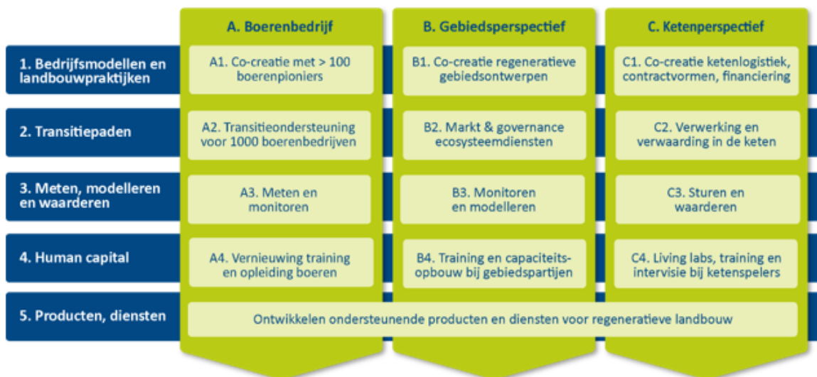
Figuur 2: Actielijnen in Re-Ge-NL programma

Het Re-Ge-NL programma bestaat uit vijf actielijnen die de bovenstaande resultaten voor boeren, gebieden en het grotere systeem gaan realiseren tussen nu en 2030. Figuur 2 geeft hiervan een overzicht.